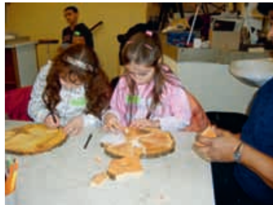
Schijven worden puzzels.