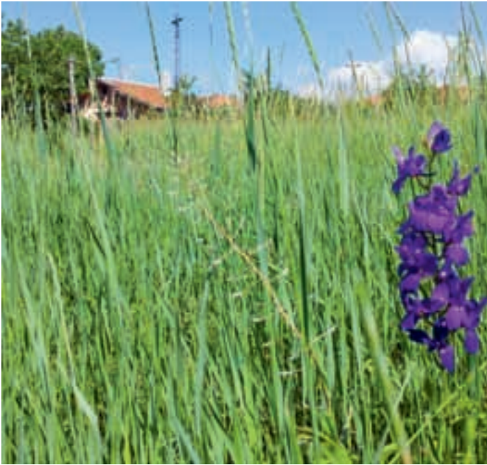
Wine Art House Elenovo - Neighbour Event.