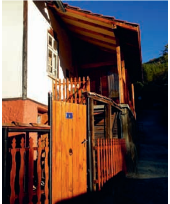
Pop Art House Elenovo - Neighbour Event.