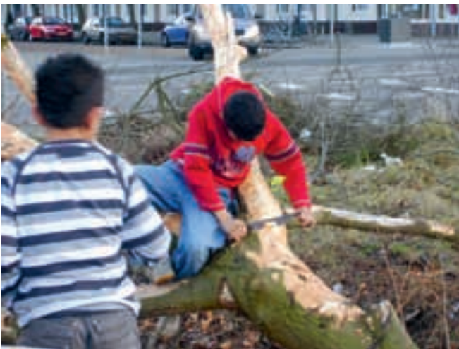
Kinderen werken aan een kunstobject van een geveld boom.