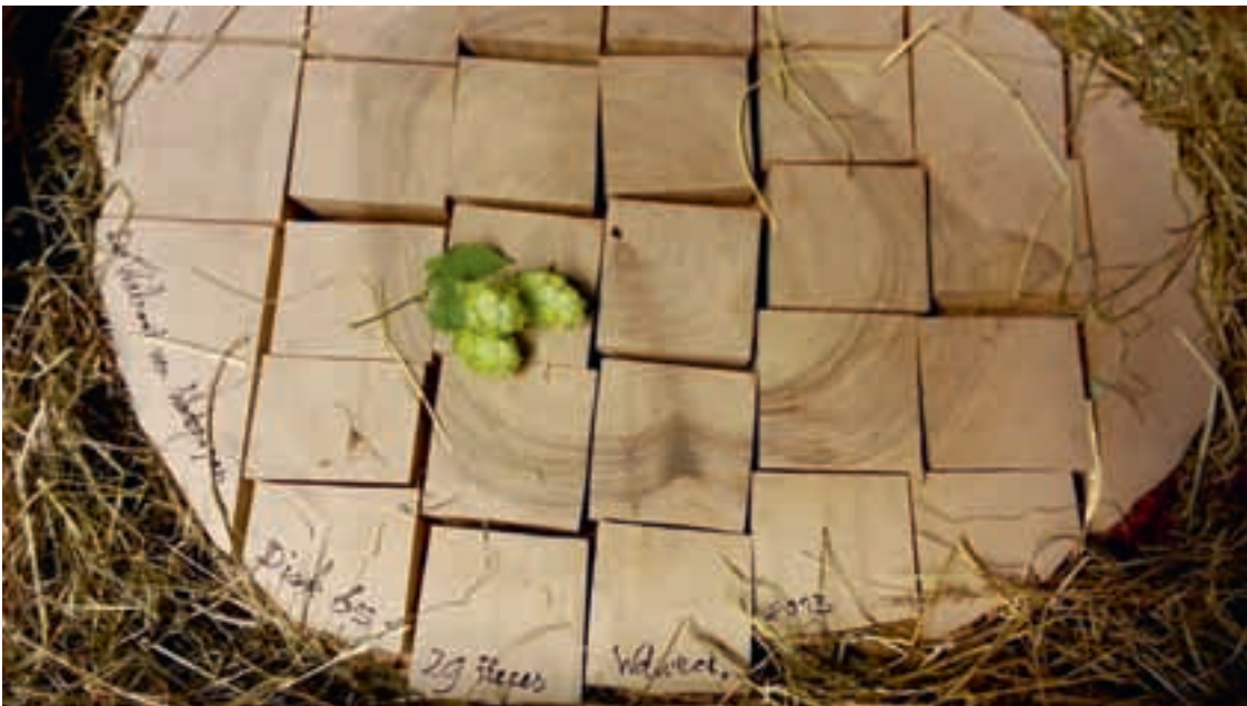
De toekomstige bezitters van deze blokjes blijven met elkaar verbonden.