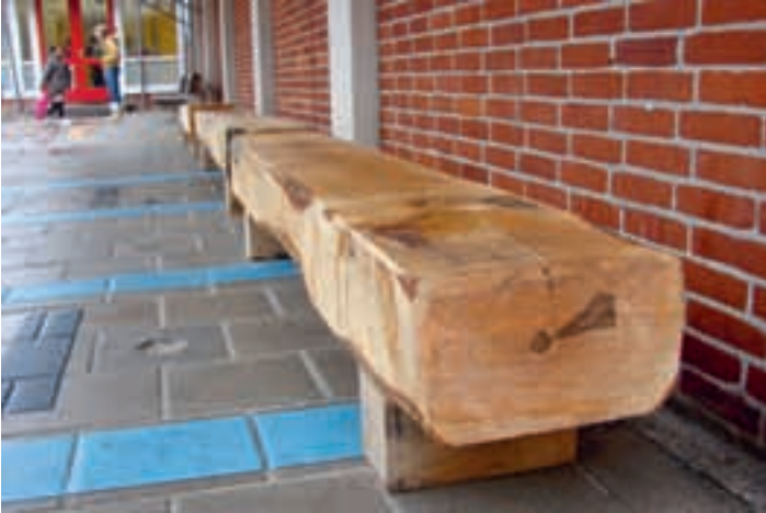
De bomen uit het sprokkelbos leven voort als bankjes op het schoolplein van de Goeman Borgesius.

Soms moeten bomen onvermijdelijk wijken voor een nieuwbouwproject. Zo ook het Sprokkelbos in Stadsdeel Geuzenveld in Amsterdam. Samen met de leerlingen van de ernaast gelegen Goeman Borgesius school deed Jos performances in het bos en verzorgde een oogstfeest. Hij begeleidde het schoolteam en de kinderen om speelgoed en kunst te maken van het hout. Ook is het gelukt om drie bomen, die geveld zouden worden, te behouden.